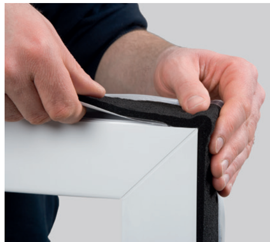
Eksempel på montering: ISO-BLOCO ONE

Til byggedybder over 82 mm kan der anvendes ISO-BLOCO ONE „SET“. Her bliver ISO-BLOCO ONE kombineret med et udvidelsesbånd (uden indvendig tætningsmembran). Begge bånd bliver påklæbt med en lille afstand på rammen. Detaljer til de mulige kombinationer som ISO-BLOCO ONE „SET“ kan findes på den aktuelle Prislister.