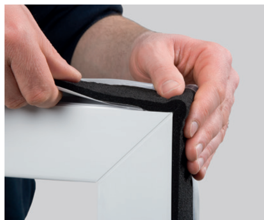
Ejemplo de instalación: ISO-BLOCO ONE

*** El movimiento de elementos estructurales y los cambios de longitud temporales de las juntas deben tenerse en cuenta para dimensionar correctamente la cinta.