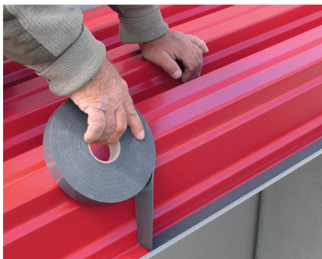
Ejemplo de instalación: ISO-ZELL FIXTAPE