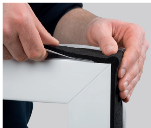
Asennuskuvan esimerkkituote: ISO-BLOCO ONE

ISO-BLOCO ONE „SET” voidaan käyttää asennuksissa joiden syvyys on enemmän kuin 82 mm. Tässä ISO-BLOCO ONE yhdistelmässä on mukana toinen paisuva nauha (ilman sisäpuolista höyrynsulkukalvoa) Asennettaessa nauhoja karmin ympärille rinnakkain jätetään näiden väliin pieni rako. Katso viimeisimmästä tuotelistasta ISO-BLOCO ONE „SET” nauhan saatavilla olevat vaihtoehdot.