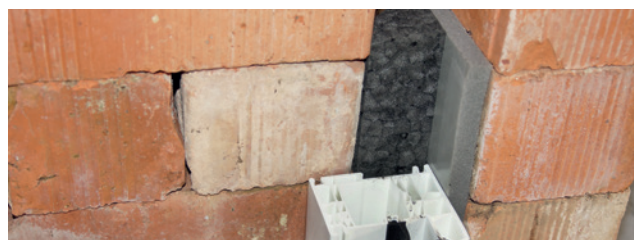
Esempio di installazione: ISO-BLOCO FILLER