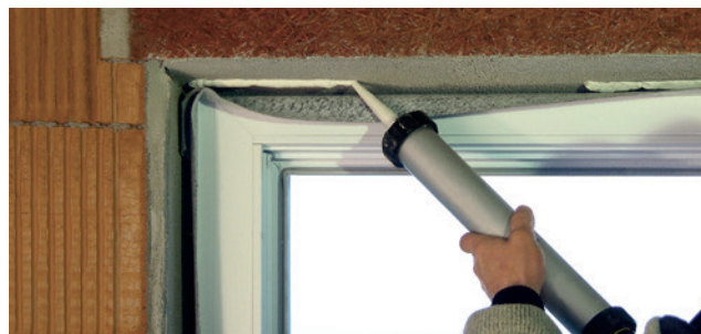
Esempio di applicazione: ISO-TOP ADESIVO FLEX SP